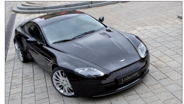
Komplettträdersatz/Comb. wheels tires: Felgen vorne/Wheels front Vertigo Viginti 9x20 Felgen hinten/Wheels rear Vertigo Viginti 11x20

The myth Aston Martin is both, impressing and fascinating. The design is a mix of a muscle man and driving understatement. For personalized wishes has Aston Martin nearly no boundaries. In order to eliminate the boundaries, Loder1899 started their program. To meet the sportive needs of an Aston Martin driver, aims Loder1899 on discreet, technical superior modifications for all Aston Martin models.