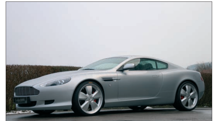
Komplettträdersatz/Comb. wheels tires: Felgen vorne/Wheels front Hollow spoke 9,5x21, Reifen 255/30-21 Felgen hinten/Wheels rear Hollow spoke 9,5x21, Reifen 295/25-21