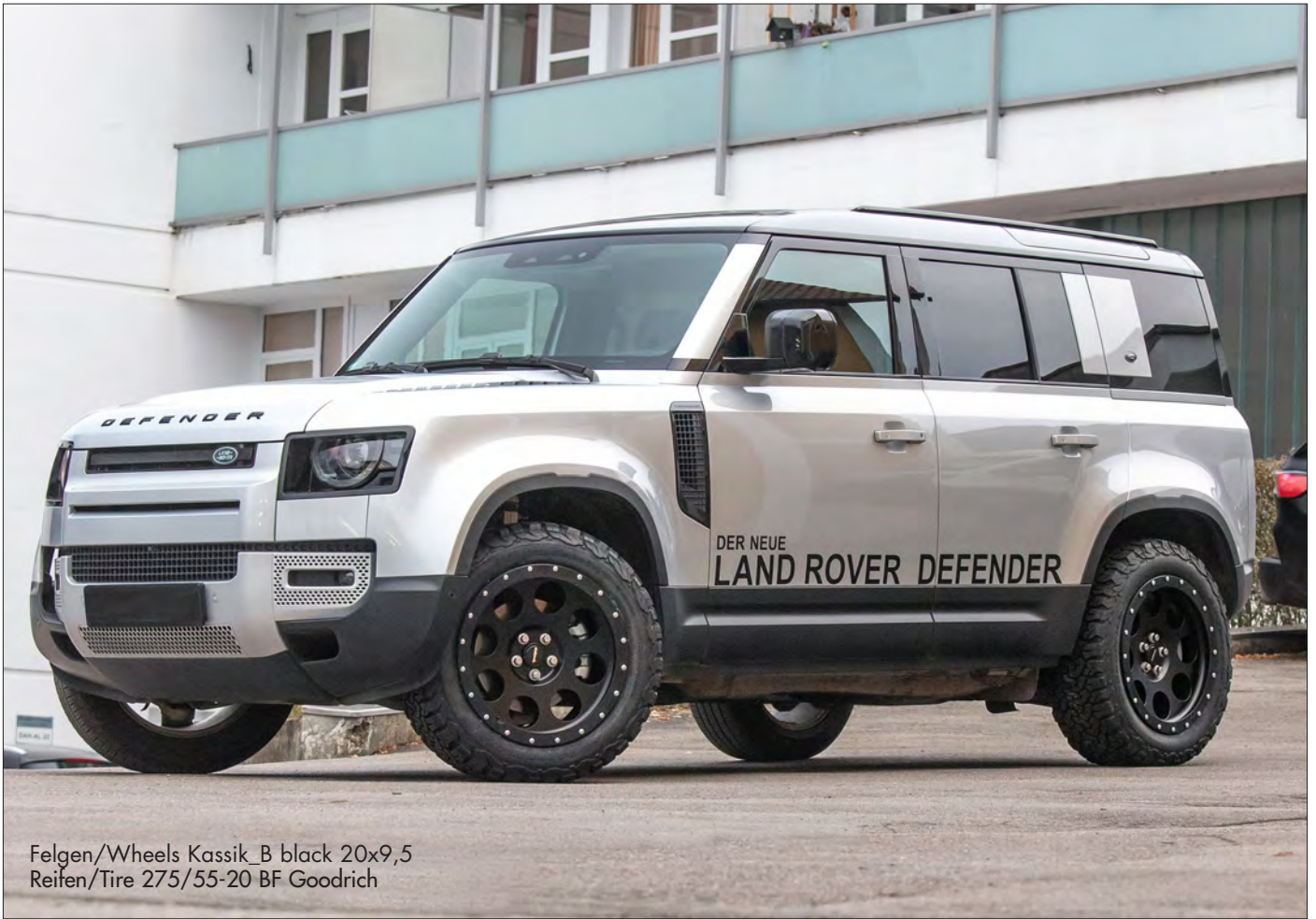
Felgen/Wheels Kassik_B black 20x9,5 Reifen/Tire 275/55-20 BF Goodrich