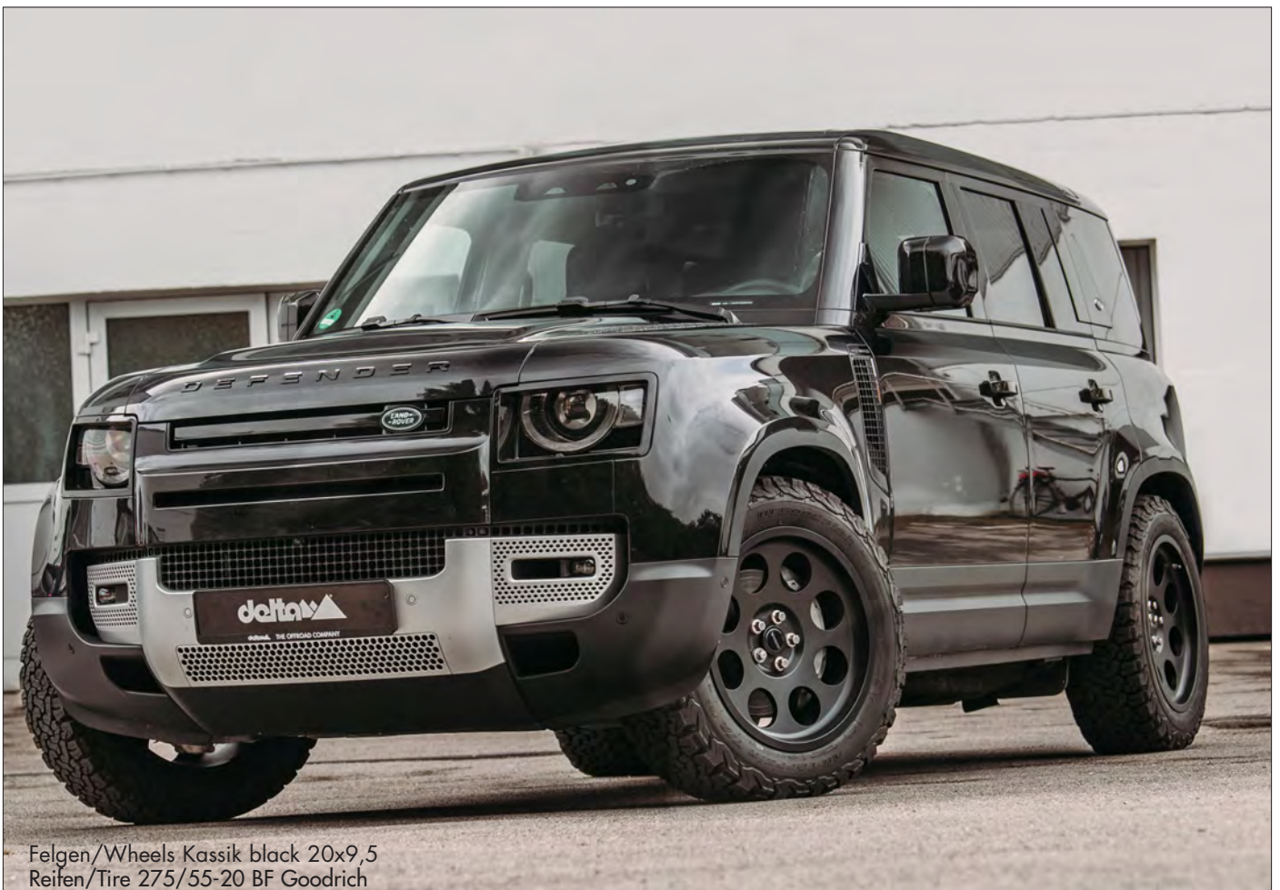
Felgen/Wheels Kassik black 20x9,5 Reifen/Tire 275/55-20 BF Goodrich