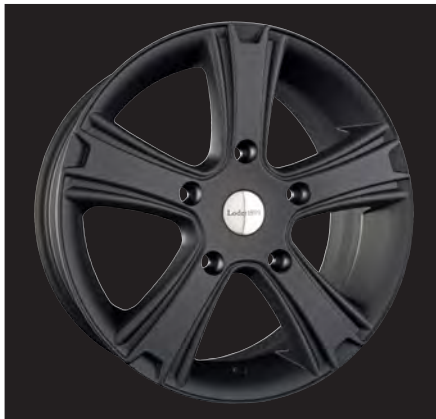
Gravoso schwarz matt/black matt 18x7,5