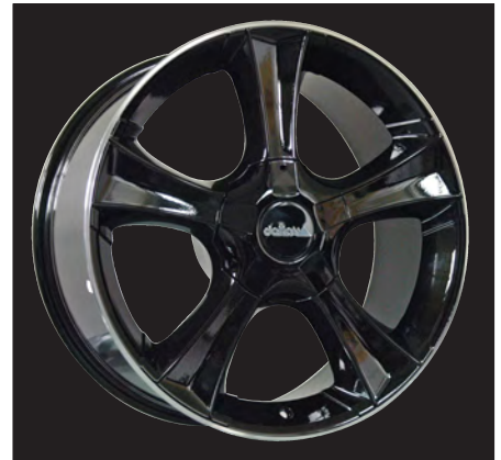
Sins schwarz hornpoliert/black lip polished 18x8