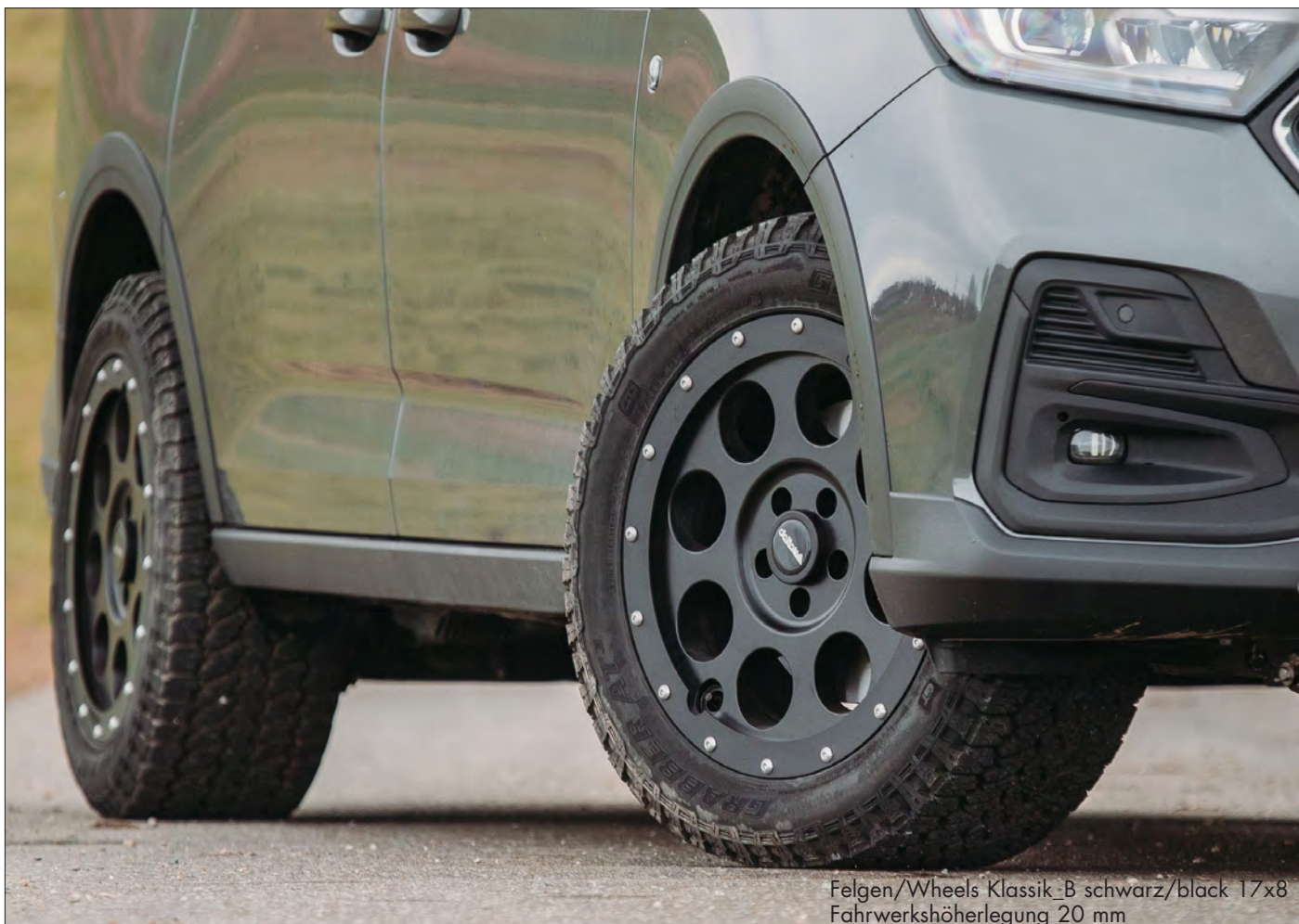
Felgen/Wheels Klassik_B schwarz/black 17x8 Fahrwerkshöherlegung 20 mm