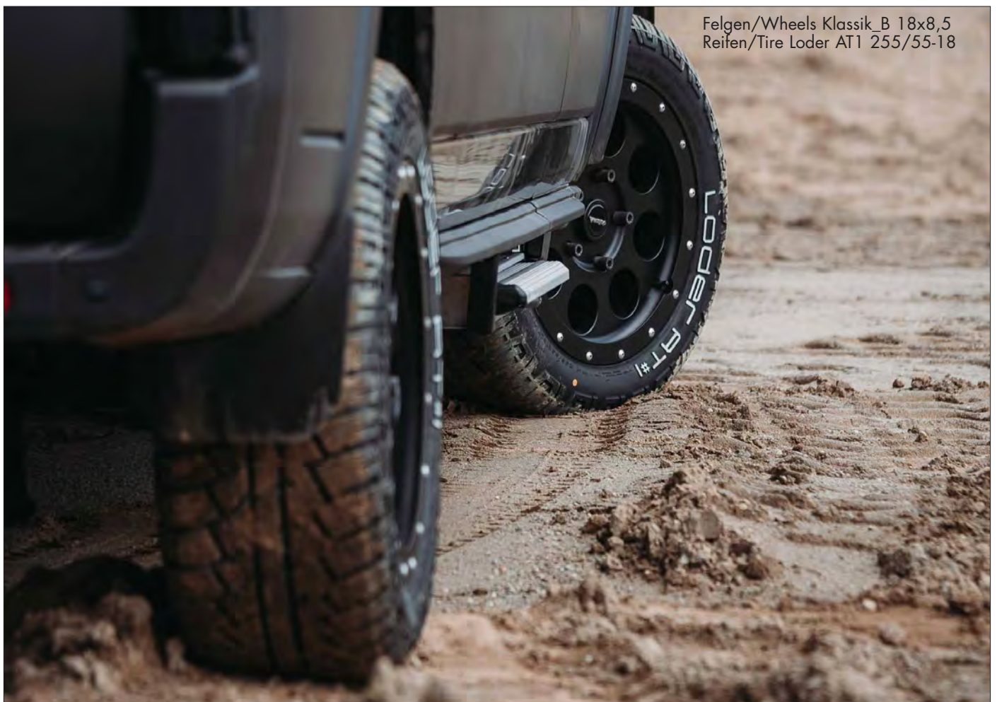
Felgen/Wheels Klassik_B 18x8,5 Reifen/Tire Loder AT1 255/55-18