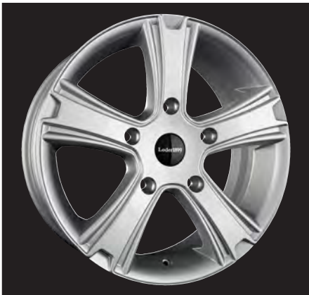
Gravoso silber/silver 18x7,5