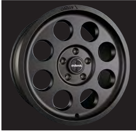
Klassik schwarz matt/black matt 18x8,5