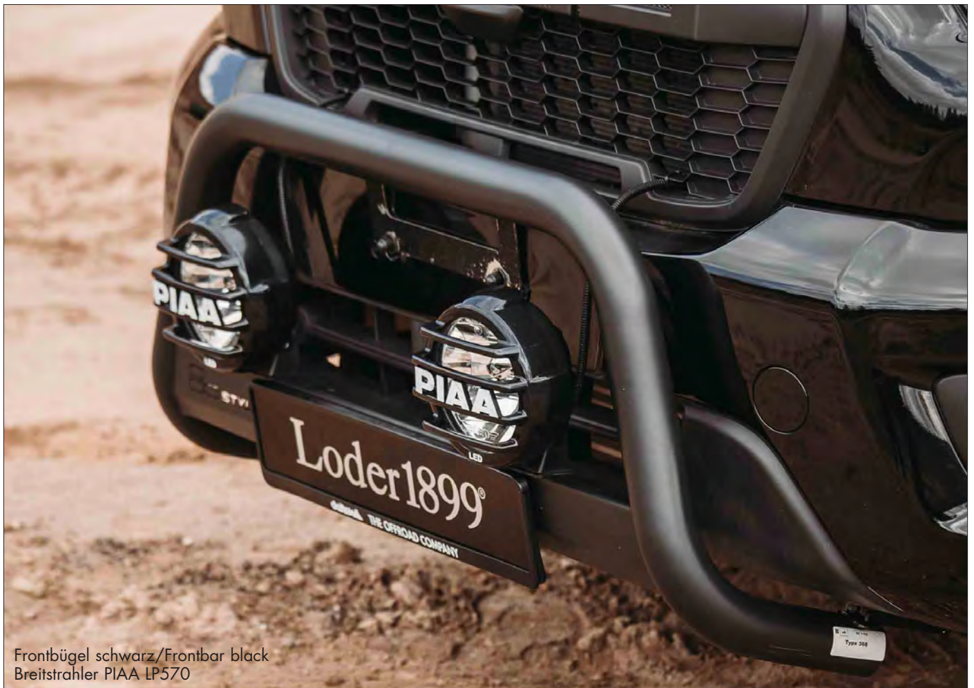
Frontbügel schwarz/Frontbar black Breitstrahler PIAA LP570