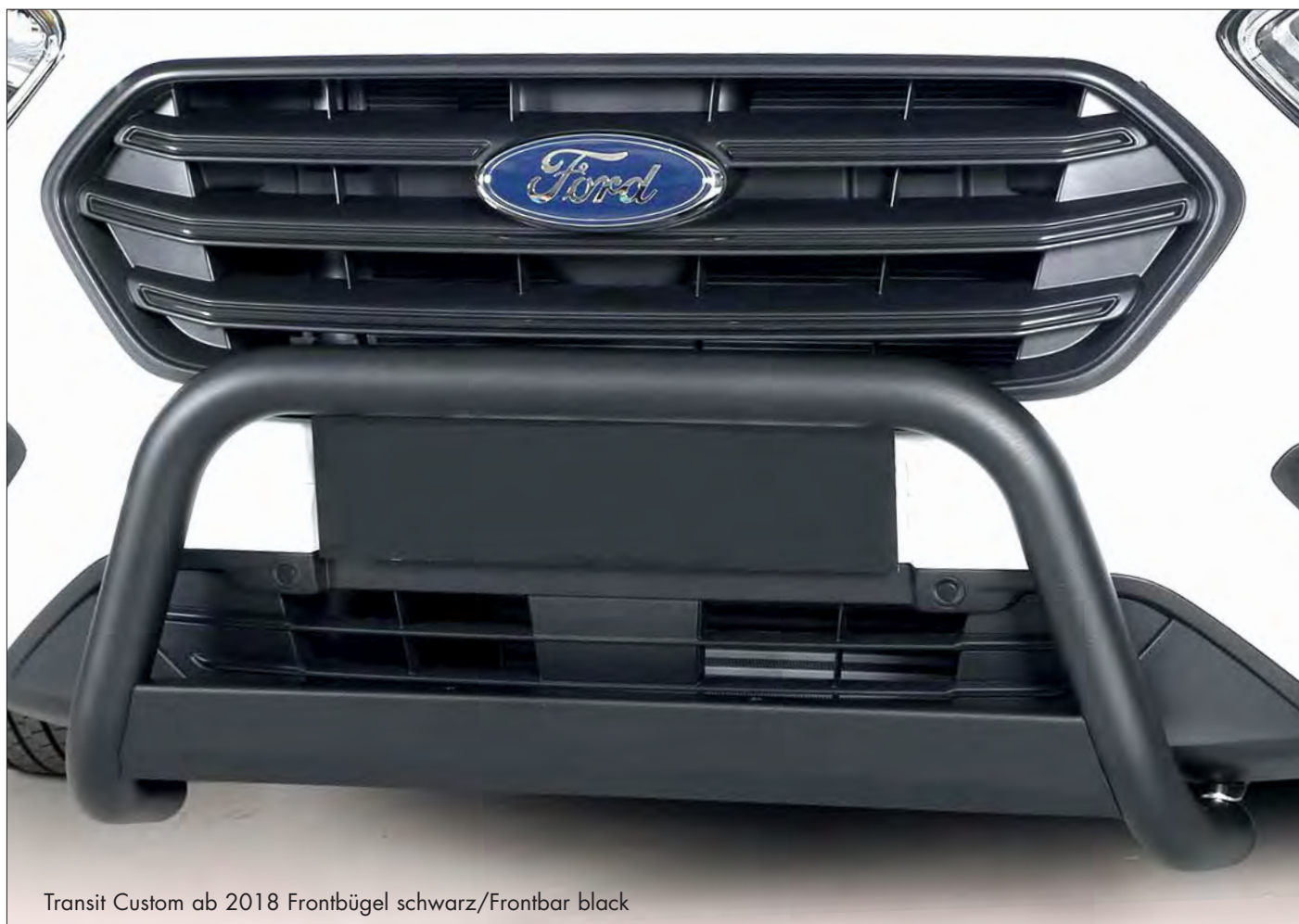
Transit Custom ab 2018 Frontbügel schwarz/Frontbar black