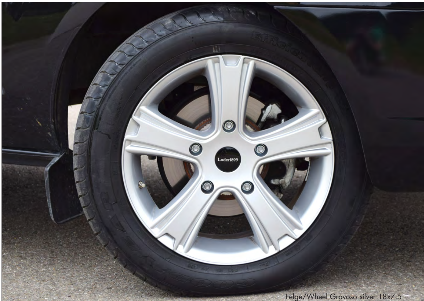
Felge/Wheel Gravoso silver 18x7,5