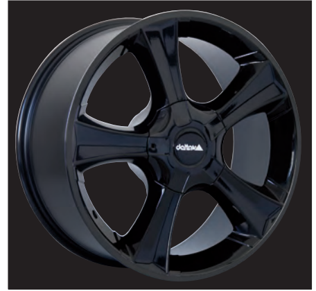
Sins schwarz glanz/black shiny 18x8