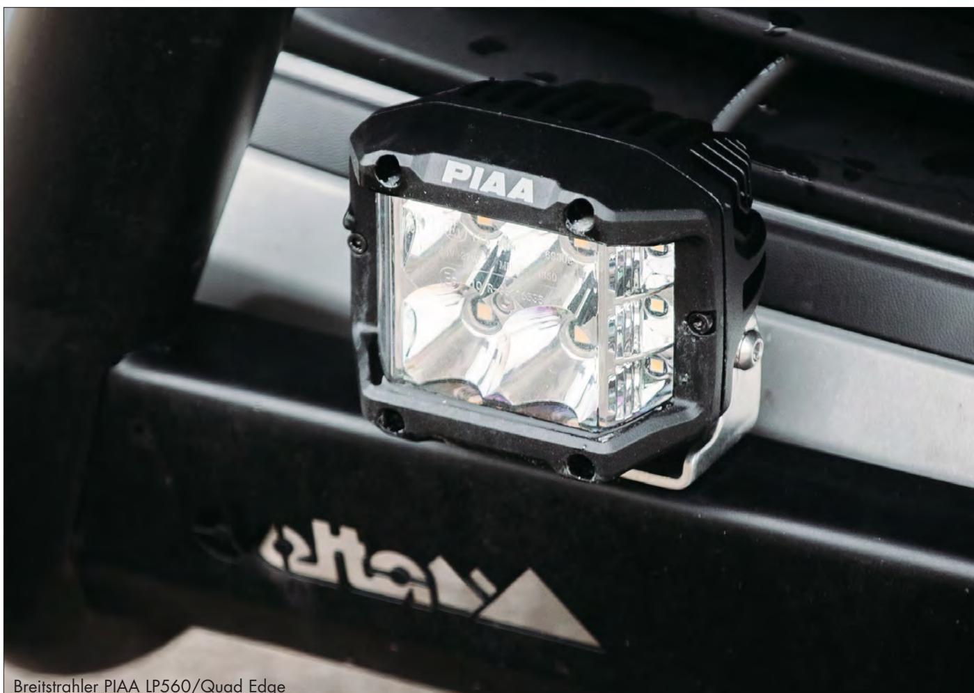
Breitstrahler PIAA LP560/Quad Edge