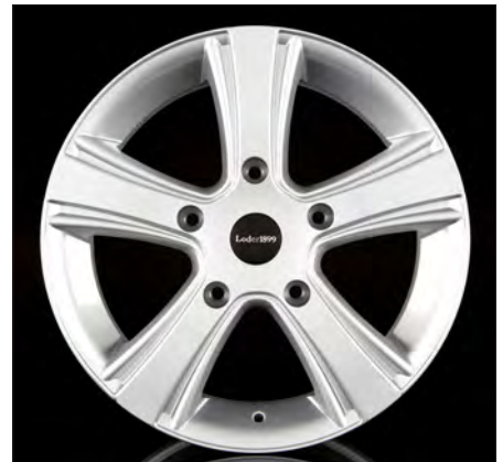
Bolzano silber/silver 17x7,5