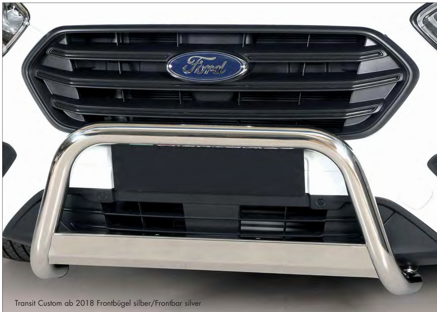
Transit Custom ab 2018 Frontbügel silber/Frontbar silver