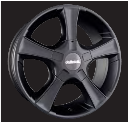
Sins schwarz matt/black matt 18x8