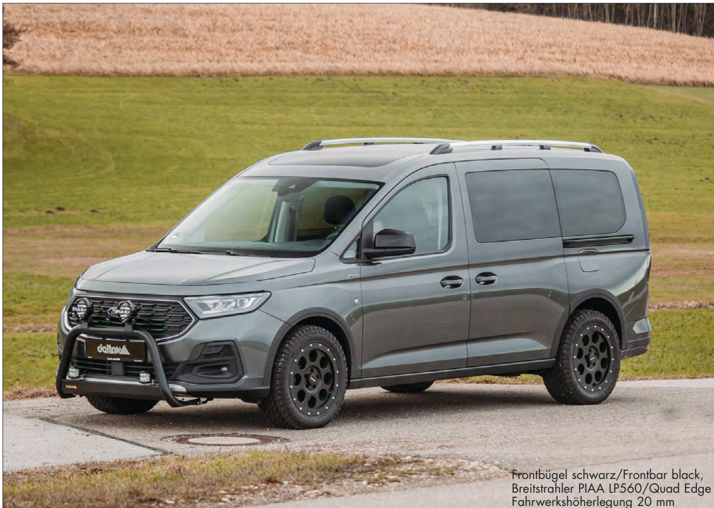
Frontbügel schwarz/Frontbar black, Breitstrahler PIAA LP560/Quad Edge Fahrwerkshöherlegung 20 mm