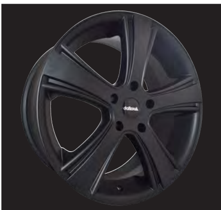
Bolzano schwarz/black 17x7,5