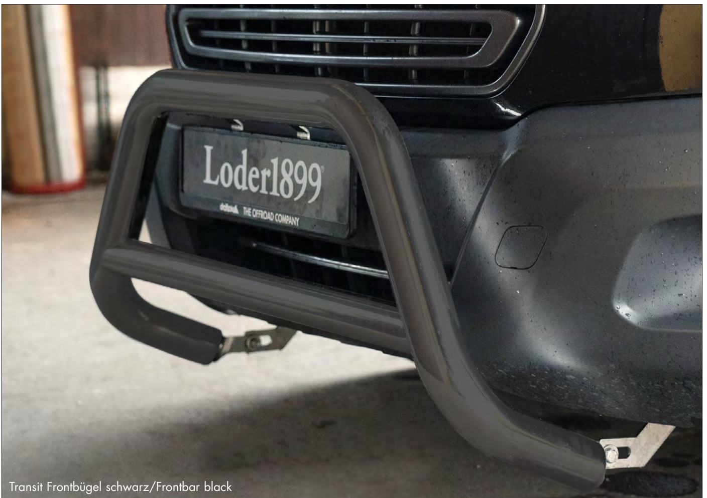
Transit Frontbügel schwarz/Frontbar black