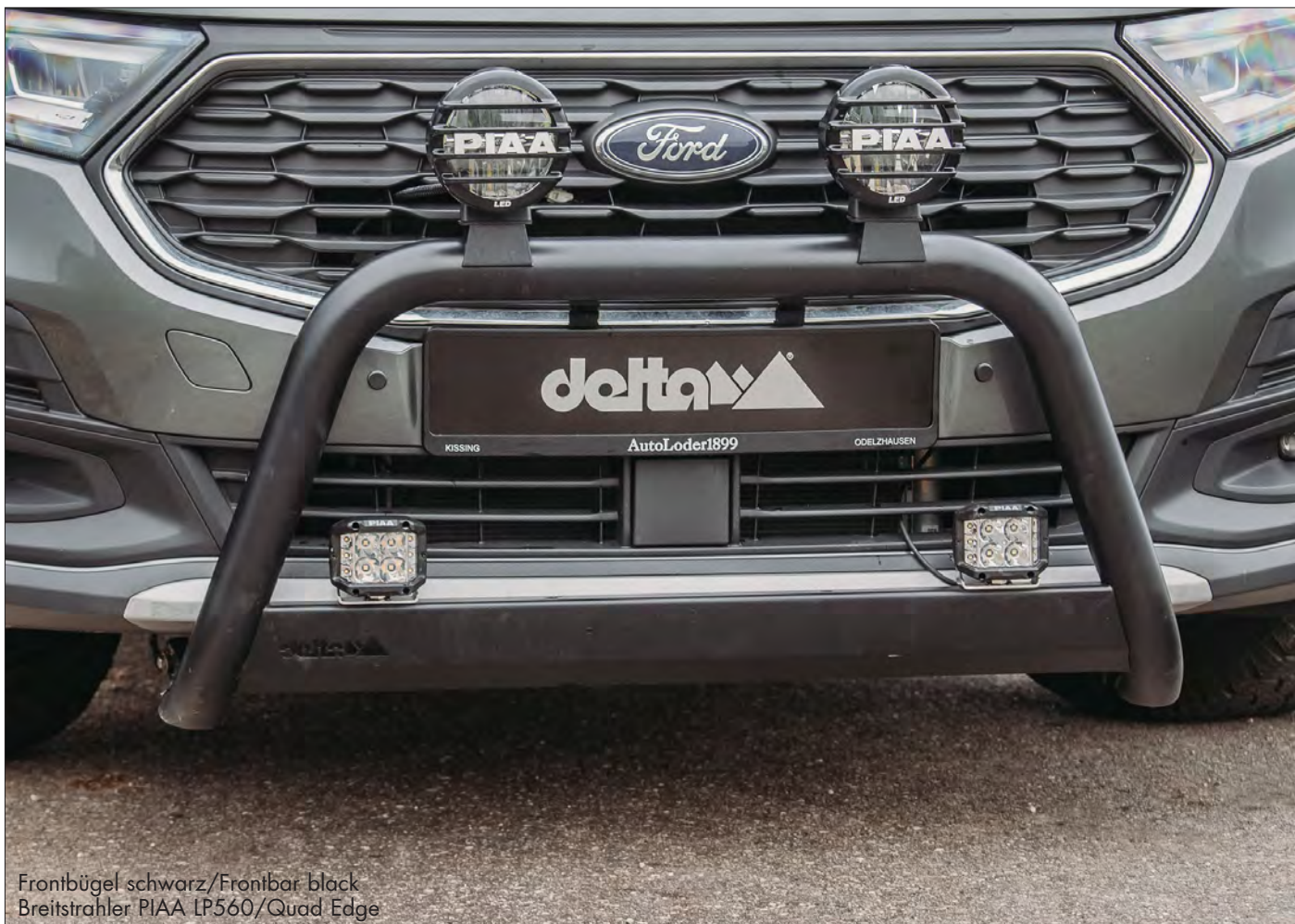
Frontbügel schwarz/Frontbar black Breitstrahler PIAA LP560/Quad Edge