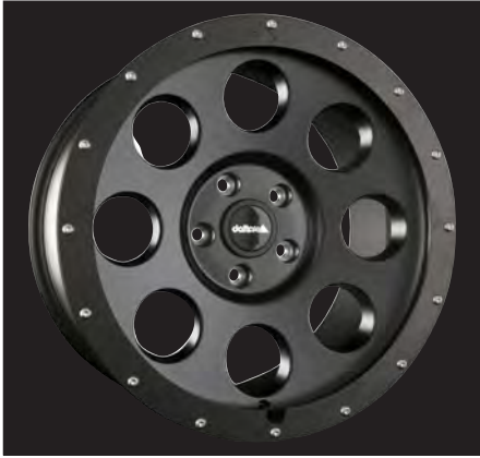
Klassik_B schwarz matt/black matt 18x8,5