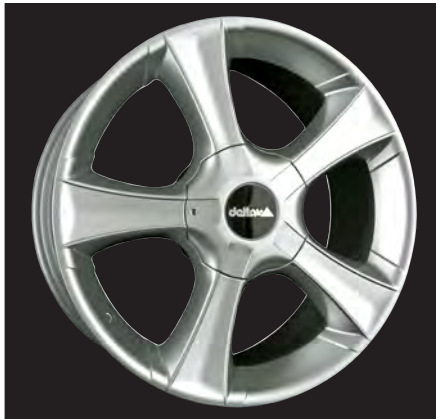
Sins silber/silver 18x8