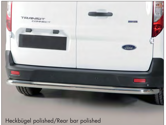
Heckbügel polished/Rear bar polished