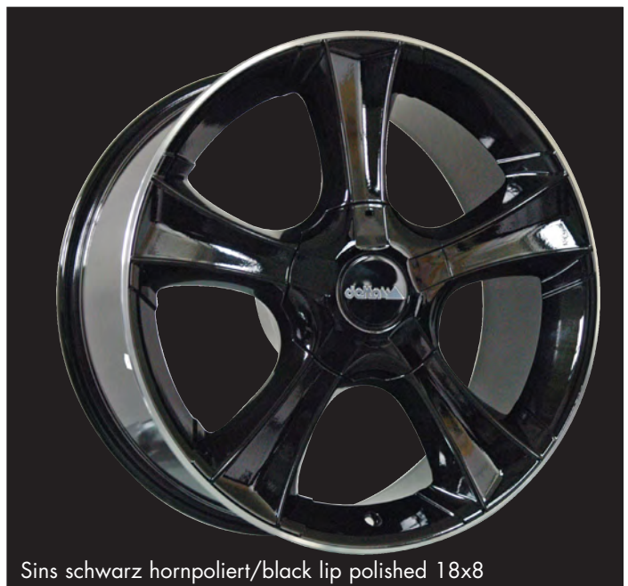
Sins schwarz hornpoliert/black lip polished 18x8