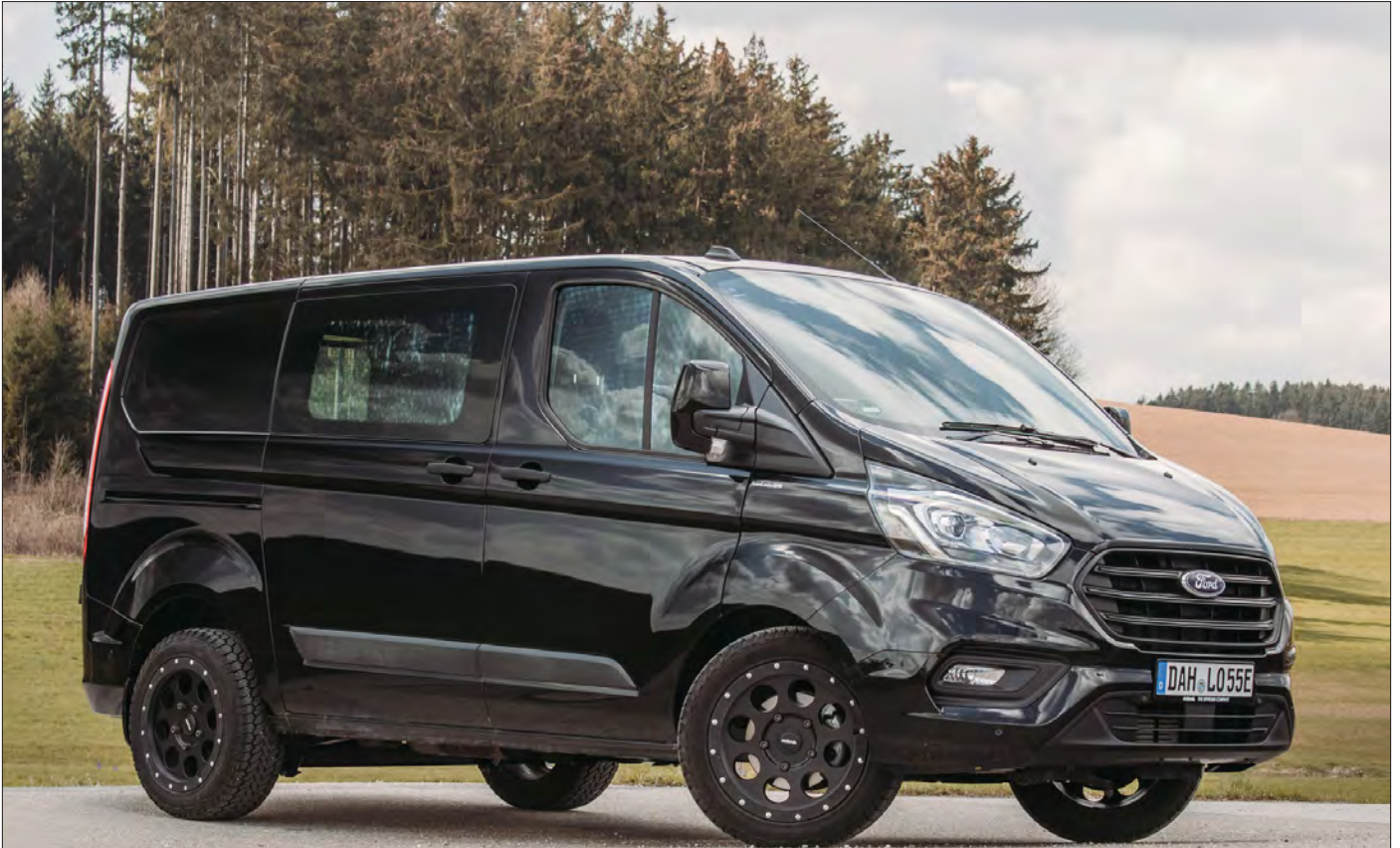
Felgen/Wheels Klassik_B schwarz matt/black matt 18x8,5