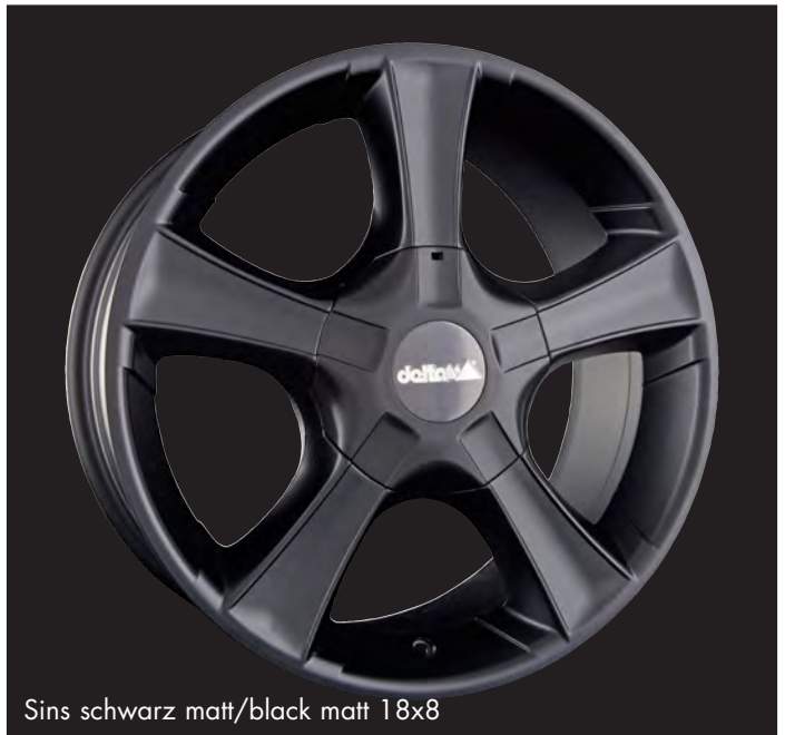
Sins schwarz matt/black matt 18x8