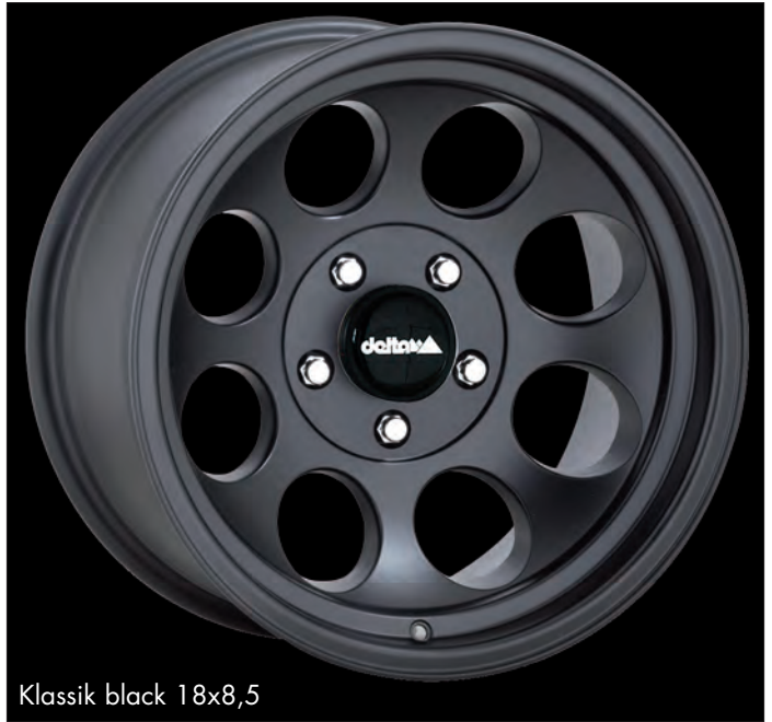
Klassik black 18x8,5