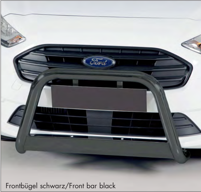
Frontbügel schwarz/Front bar black