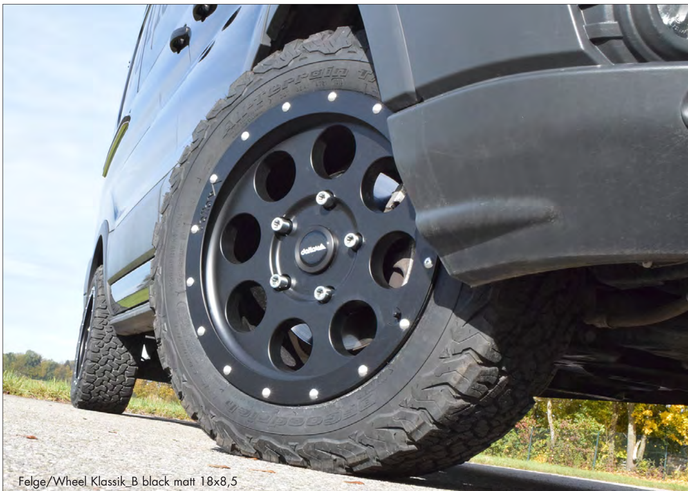
Felge/Wheel Klassik_B black matt 18x8,5