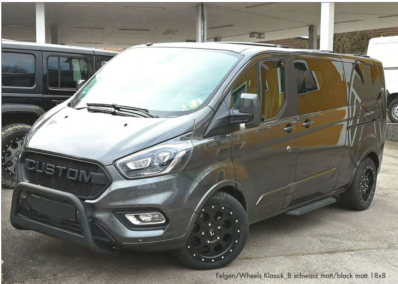
Felgen/Wheels Klassik_B schwarz matt/black matt 18x8