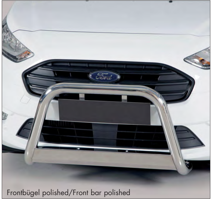
Frontbügel polished/Front bar polished