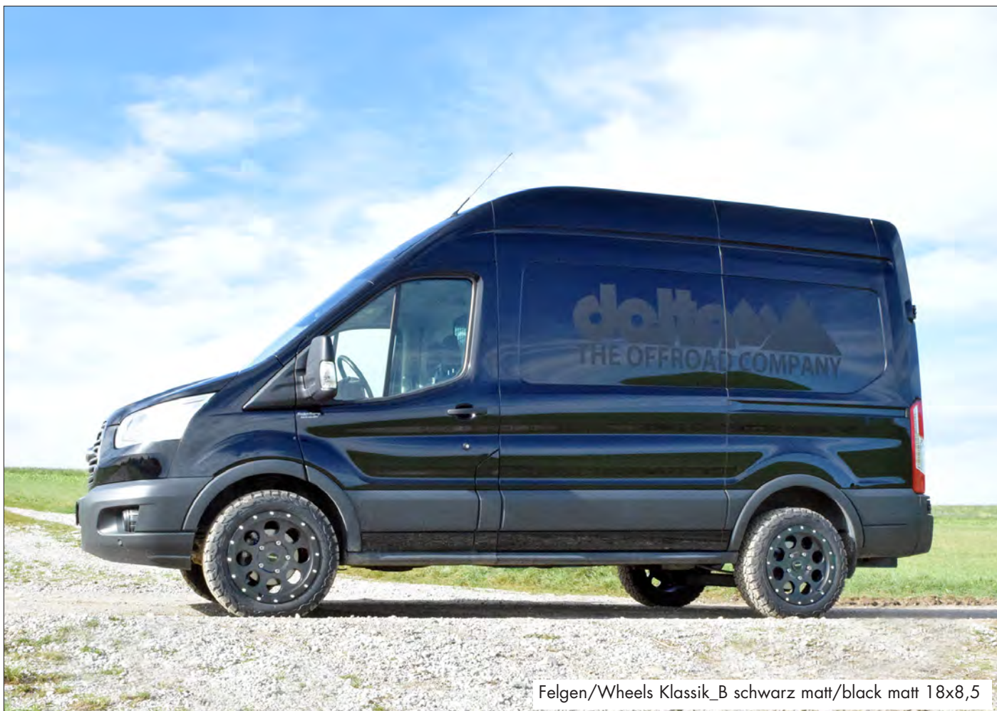
Felgen/Wheels Klassik_B schwarz matt/black matt 18x8,5