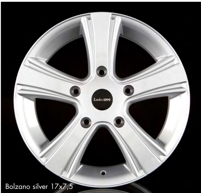
Bolzano silver 17x7,5