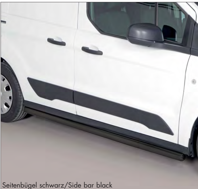
Seitenbügel schwarz/Side bar black