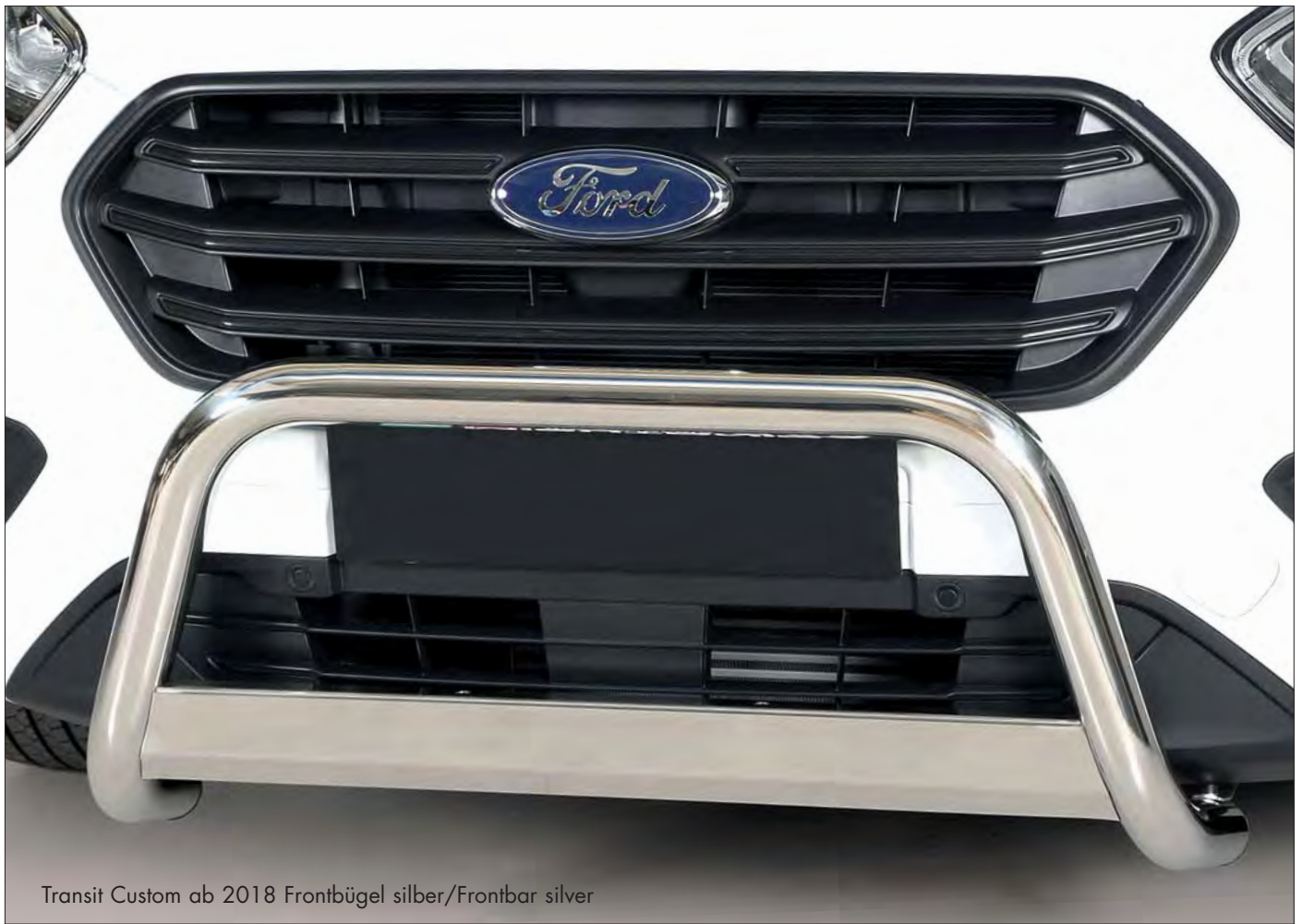
Transit Custom ab 2018 Frontbügel silber/Frontbar silver