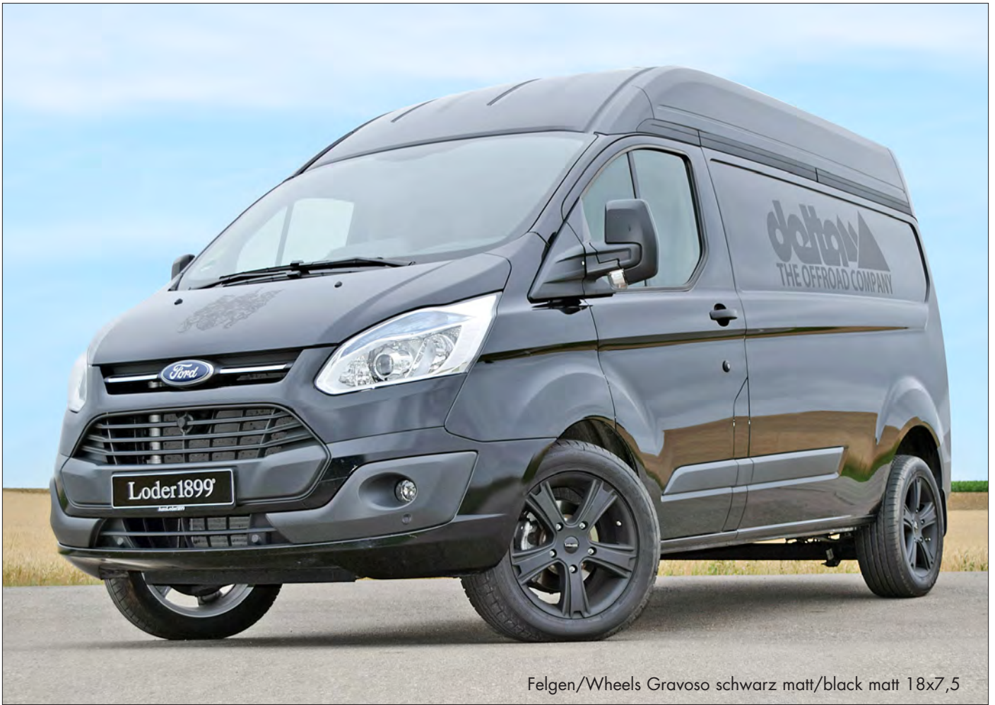
Felgen/Wheels Gravoso schwarz matt/black matt 18x7,5