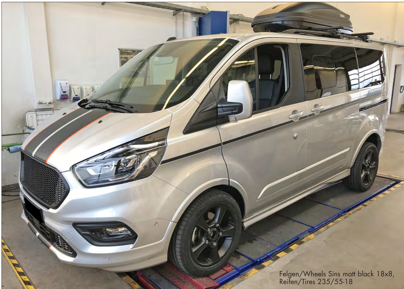
Felgen/Wheels Sins matt black 18x8, Reifen/Tires 235/55-18