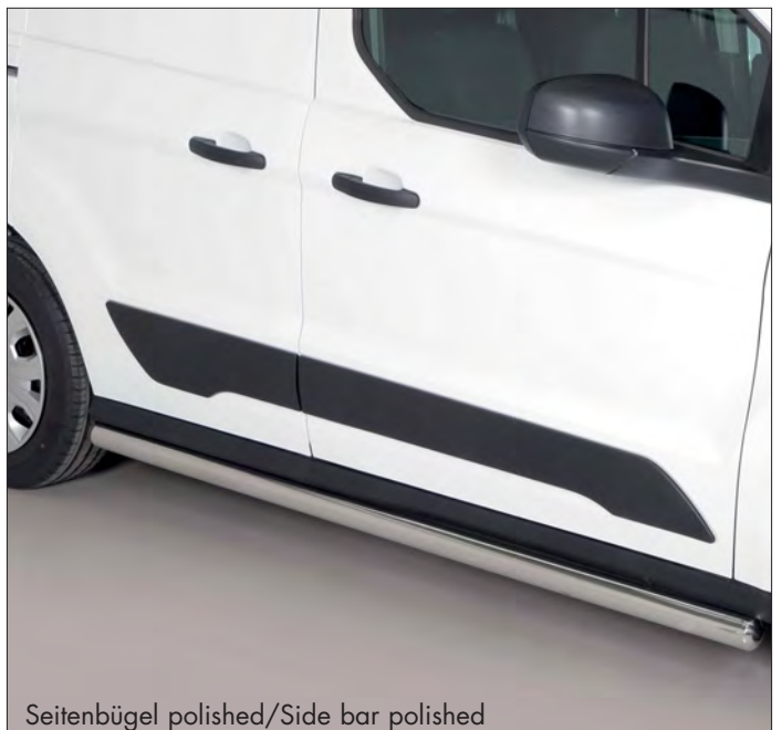
Seitenbügel polished/Side bar polished