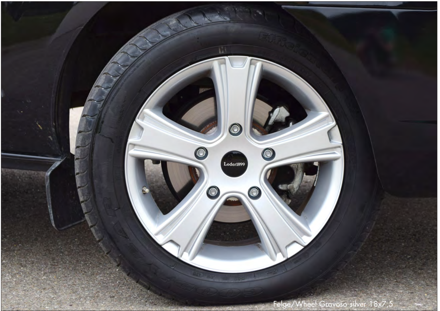
Felge/Wheel Gravoso silver 18x7,5