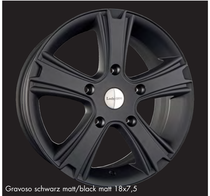
Gravoso schwarz matt/black matt 18x7,5