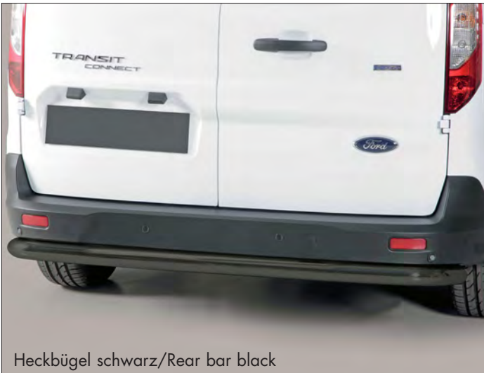
Heckbügel schwarz/Rear bar black