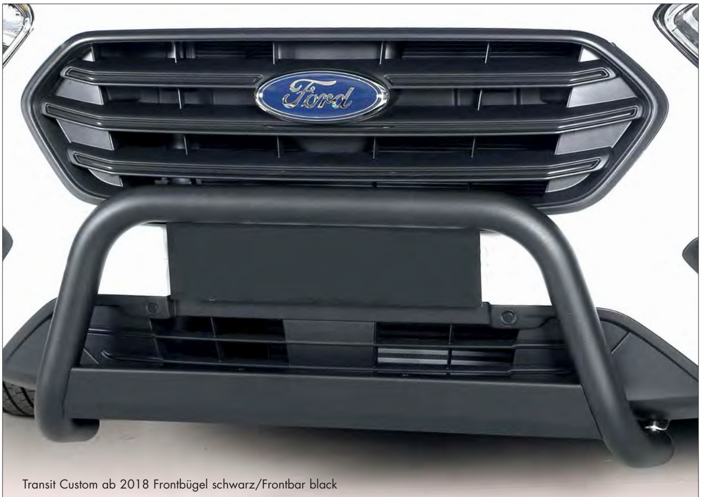
Transit Custom ab 2018 Frontbügel schwarz/Frontbar black