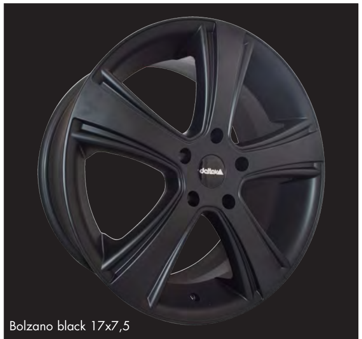
Bolzano black 17x7,5