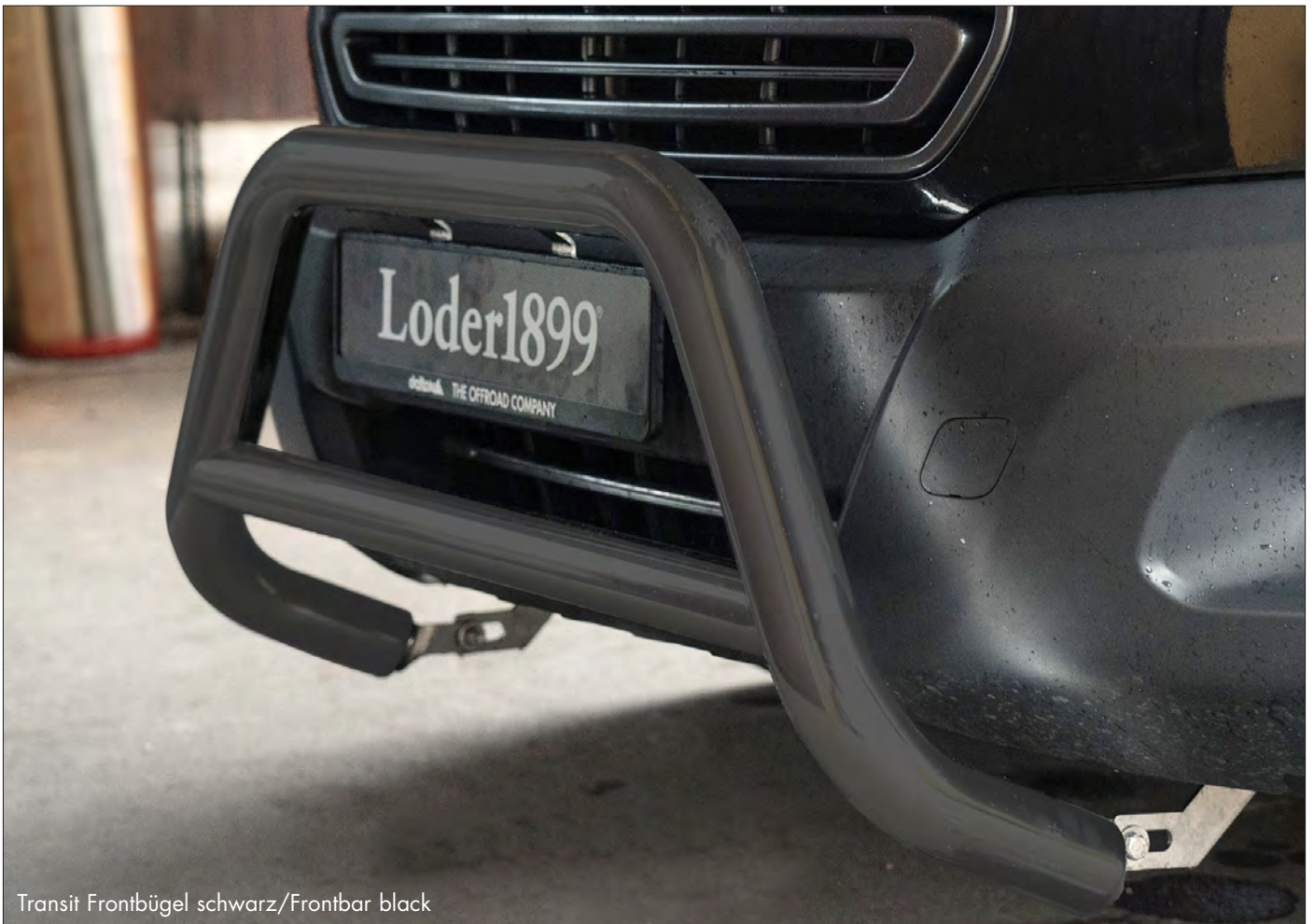
Transit Frontbügel schwarz/Frontbar black