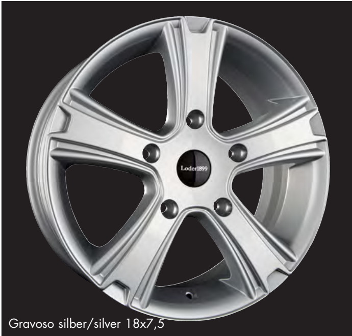
Gravoso silber/silver 18x7,5