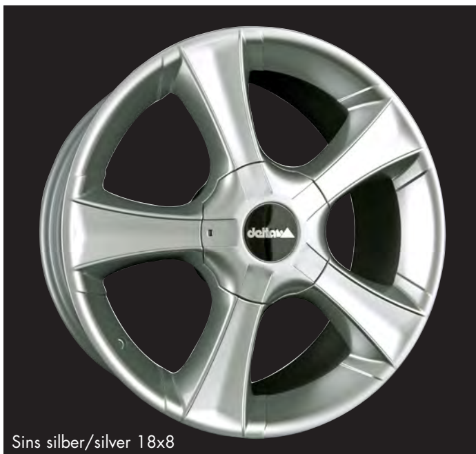
Sins silber/silver 18x8