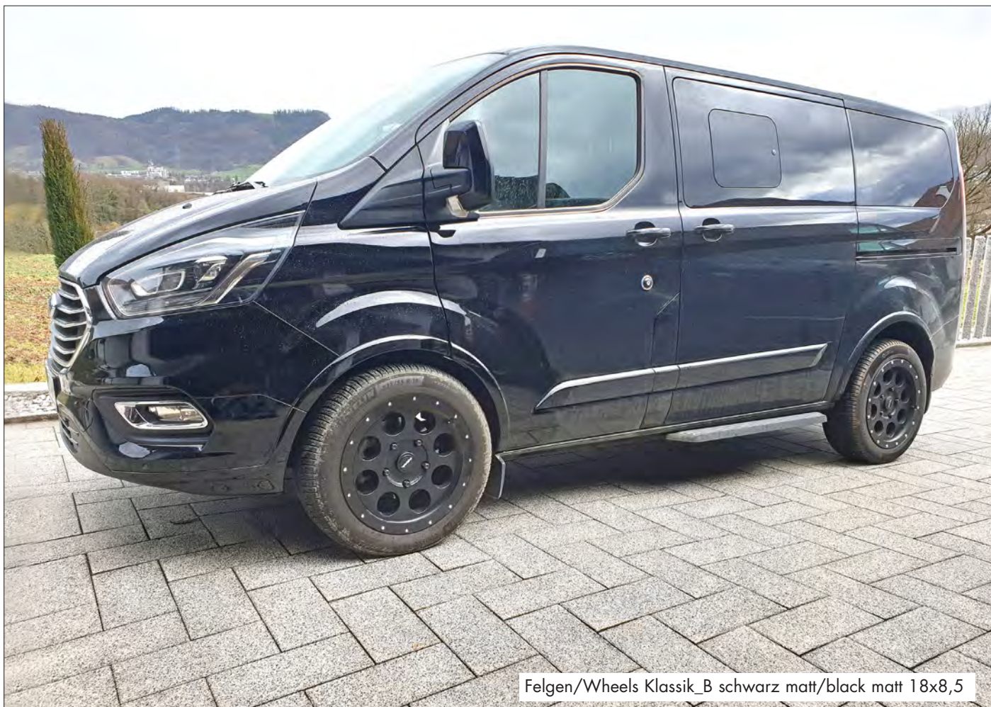
Felgen/Wheels Klassik_B schwarz matt/black matt 18x8,5