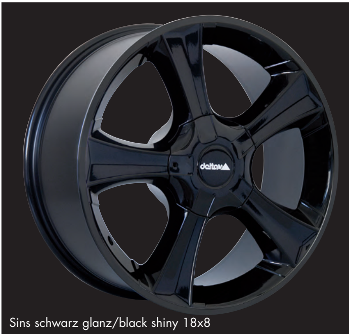
Sins schwarz glanz/black shiny 18x8