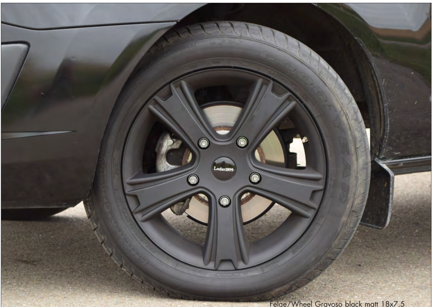
Felge/Wheel Gravoso black matt 18x7,5