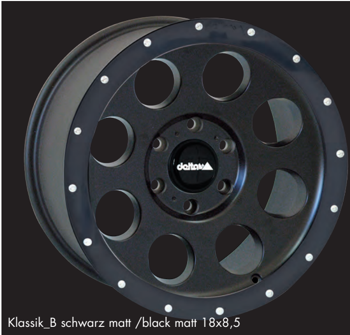
Klassik_B schwarz matt /black matt 18x8,5