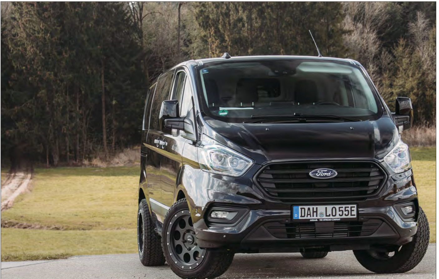
Felgen/Wheels Klassik_B schwarz matt/black matt 18x8,5