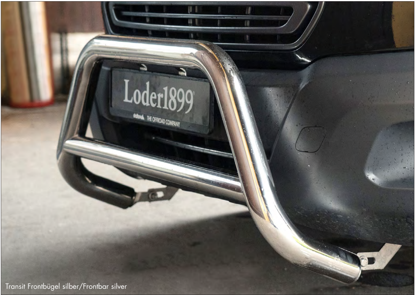
Transit Frontbügel silber/Frontbar silver