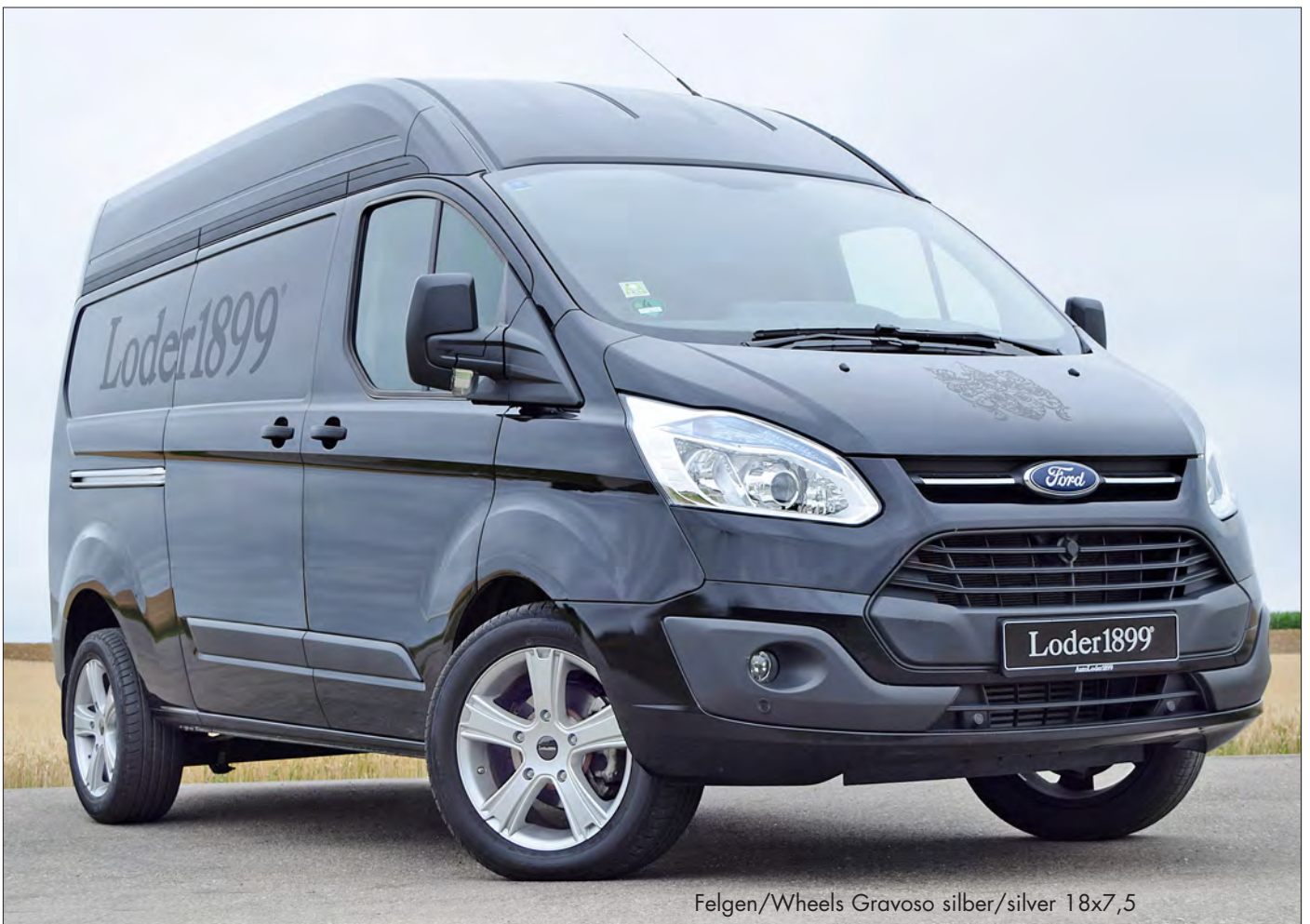
Felgen/Wheels Gravoso silber/silver 18x7,5